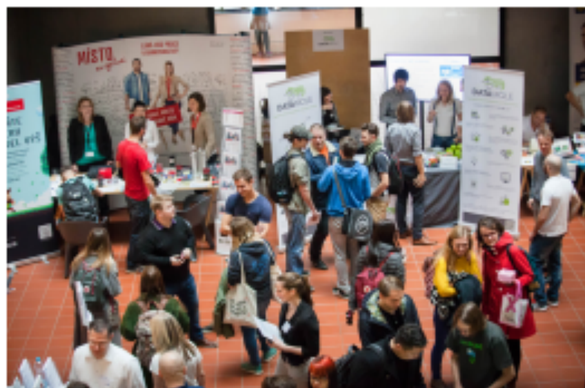
Veletřh CoFIT 2017