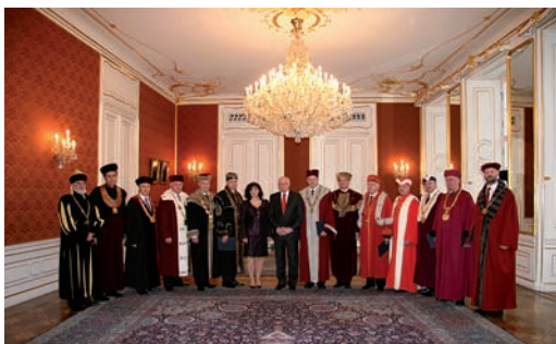
Prezident republiky Václav Klaus, ministryně školství Miroslava Kopicová a nově jmenovaní rektori

Prezident republiky Václav Klaus jmenoval 14. ledna 2010 za přítomnosti ministryně školství, mládeže a tělovýchovy Miroslavy Kopicové rektory 13 veřejných vysokých škol.