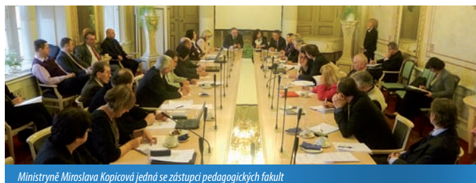
Ministryně Miroslava Kopicová jedná se zástupci pedagogických fakult

Příliš vysoký podíl nekvalifikovaných učitelů je jedním z bolavých míst českého, moravského a slezského školství. MŠMT proto chce nyní v rámci Operačního programu Vzdělávání pro konkurenceschopnost vyčlenit na další vzdělávání pedagogů 130 milionů korun z evropských prostředků. „Předpokládáme, že příjemci podpory budou hlavně vysoké školy a další instituce oprávněné vydávat certifikáty vztahující se ke vzdělávání pedagogů podle příslušných předpisů. Zde je velká příležitost pro pedagogické fakulty, aby svoji nabídku rozšířily,“ upozornila ministryně Kopicová.