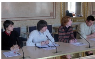
Členové Studentského fóra na MSMT v červnu 2009

Přinášíme informace o projektu Studentského fóra, který si za cíl stanovil podpořit reformu maturitní zkoušky.