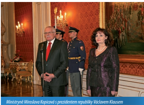
Ministryně Miroslava Kopicová s prezidentem republiky Václavem Klausem