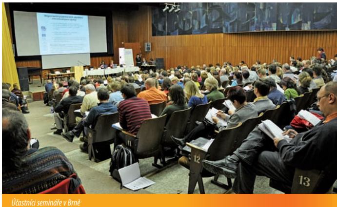
Účastníci semináře v Brně

Více informací k Operačnímu programu Vzdelávání pro konkurenceschopnost naleznete na internetové stránce MŠMT www.msmt.cz/strukturalni-fondy/op-vpk-obdobi-2007-2013 .