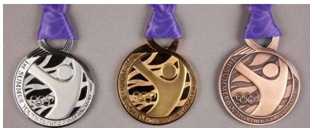
Medaile Olympijských her mládeže, Singapur 2010