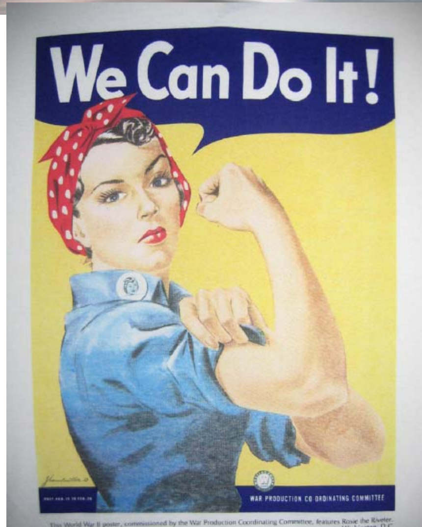
This World War II poster, commissioned by the War Production Coordinating Committee, features Rosie the Riveter. Washington, D.C.