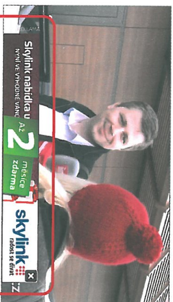
Dnes 14.03. - 17.03.2014

Jedny z prvních parkovacích stání pro ženy se nacházejí v okolí do restaurace McDonald's na rybníhoštní silnici R10 v Praze-Horních Počernicích. Rozměrově se nijak neliší od stávajících parkovacích míst, jsou jen jednoduše označena bílým nápisem "ŽENY".