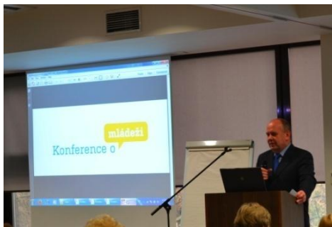
Ministr školství, mládeže a tělovýchovy Dalibor Štys

Ve dnech 8. a 9. listopadu 2013 uspořádalo MŠMT ve spolupráci s Českou národní agenturou Mládež v Praze národní konferenci o mládeži, která poskytla platformu pro hodnocení „ Koncepce státní politiky pro oblast dětí a mládeže na období 2007-2013 “. Účastníkům byla představena aktuální národní zpráva o mládeži , a poté měli příležitost aktivně se podílet na přípravě nového strategického dokumentu pro politiku mládeže na období 2014 – 2020 . Konference, které se zúčastnili vedle ministra školství, mládeže a tělovýchovy Dalibora Štysa a zástupkyně Evropské komise i cizinci pracující v České republice s mládeží, byla zaměřena především na sdílení zkušeností z praxe a hodnocení končícího sedmiletého období evropského programu Mládež v akci .