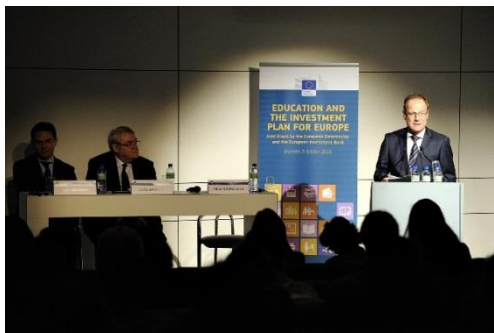
Komisař Tibor Navratsics

Dne 5. října se v Bruselu uskutečnila konference, jejímž cílem bylo představit možnosti pro projekty, na kterých se podílejí soukromé a veřejné investice (Public Private Partnership – PPP) v oblasti vzdělávání.