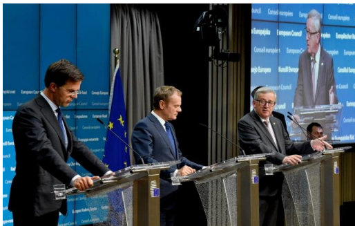
Mark Rutte, nizozemský premiér, Donald Tusk, předseda Evropské rady a Jean-Claude Juncker, prezident Evropské komise

Ve dnech 28. a 29. června 2016 se v Bruselu sešli lídři členských zemí EU, poprvé bez zástupce Velké Británie , která si v referendu dne 23. června 2016 odhlasovala odchod z Evropské unie.